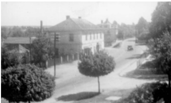
čp. 35 v 50. letech